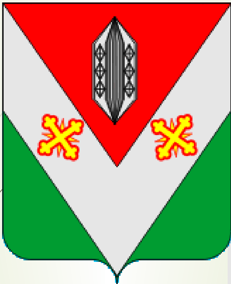
Герб города Никольска