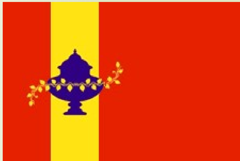
Флаг Никольского района